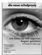
die neue schulpraxis